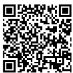
Term & Condition